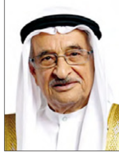
الفريق طبيب الشيخ محمد بن عبدالله

من مستوى متقدم من التطور إلى هذا المستوى المشرف من الكفاءة والجاهزية، مؤكداً الدور المتميز لصاحب السمو الملكي ولي العهد نائب القائد الأعلى رئيس مجلس الوزراء حفظه الله في كافة مجالات قوة دفاع البحرين، والذي أسهم بشكل واضح في الوصول بهذه القوة إلى مكانة عالية من التطور والكفاءة. كما هنا، المشير الركن الشيخ خليفة بن أحمد آل خليفة القائد العام لقوة دفاع البحرين، وجميع ضباط وضباط صف وأفراد قوة دفاع البحرين بهذه المناسبة الوطنية العزيزة، منوهاً بما وصلت إليه قوة دفاع البحرين