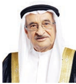
○ الشيخ محمد بن عبدالله.

وثنم الإسهامات الكبيرة والجليلة لقوة دفاع البحرين في الذود عن سيادة الوطن والحفاظ على مقدراته وأمنه واستقراره، وفي دعم ما تحققت من إنجازات تنموية على جميع المستويات، متمنياً لكل منتسبي قوة دفاع البحرين دوام التوفيق والسداد بما يدعم المسيرة التنموية الشاملة بقيادة حضرة صاحب الجلالة عاهل البلاد المفدى القائد الأعلى.