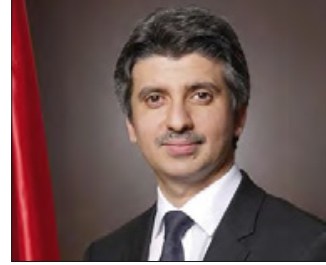
د. أحمد الأنصاري

رفع الرئيس التنفيذي للمستشفيات الحكومية الدكتور أحمد محمد الأنصاري أسمى آيات التهاني والتبريكات لحضرة صاحب الجلالة الملك حمد بن عيسى آل خليفة عاهل البلاد المفدى حفظه الله ورعاه، وإلى صاحب السمو الملكي الأمير سلمان بن حمد آل خليفة ولي العهد نائب القائد الأعلى